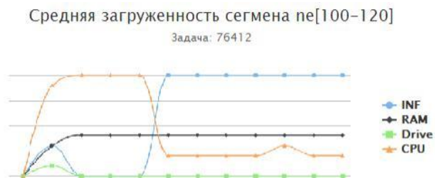
Рис. 3. График использования аппаратных ресурсов расчетной задачей (гидродинамика)

По собранным данным об использовании аппаратных ресурсов строится модель поведения задачи, которая имеет привязку к используемому решателю, модели расчета (данные о которой указываются пользователем) и пользователю системы. Визуализированная модель поведения конкретной задачи показана на рис. 3.