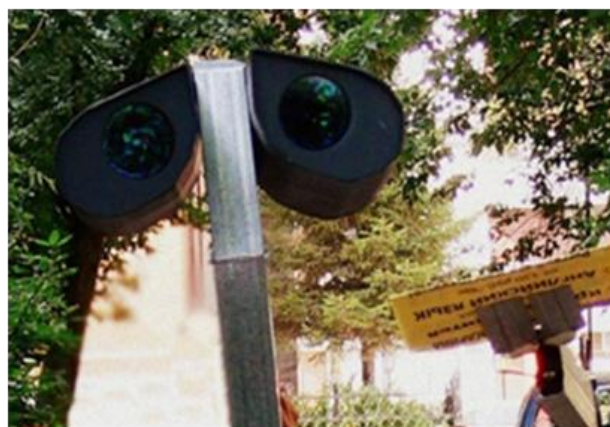
Рис. 1. Прототип робота

Данный проект призван объединить в себе все полезные навыки традиционных и современных методов программирования робототехнических систем, воплотив эту совокупность – для текущей модификации – в предмет индустрии рекламы и развлечений. Уникальная система управления разработана специально для данной модели поведения роботизированного объекта.