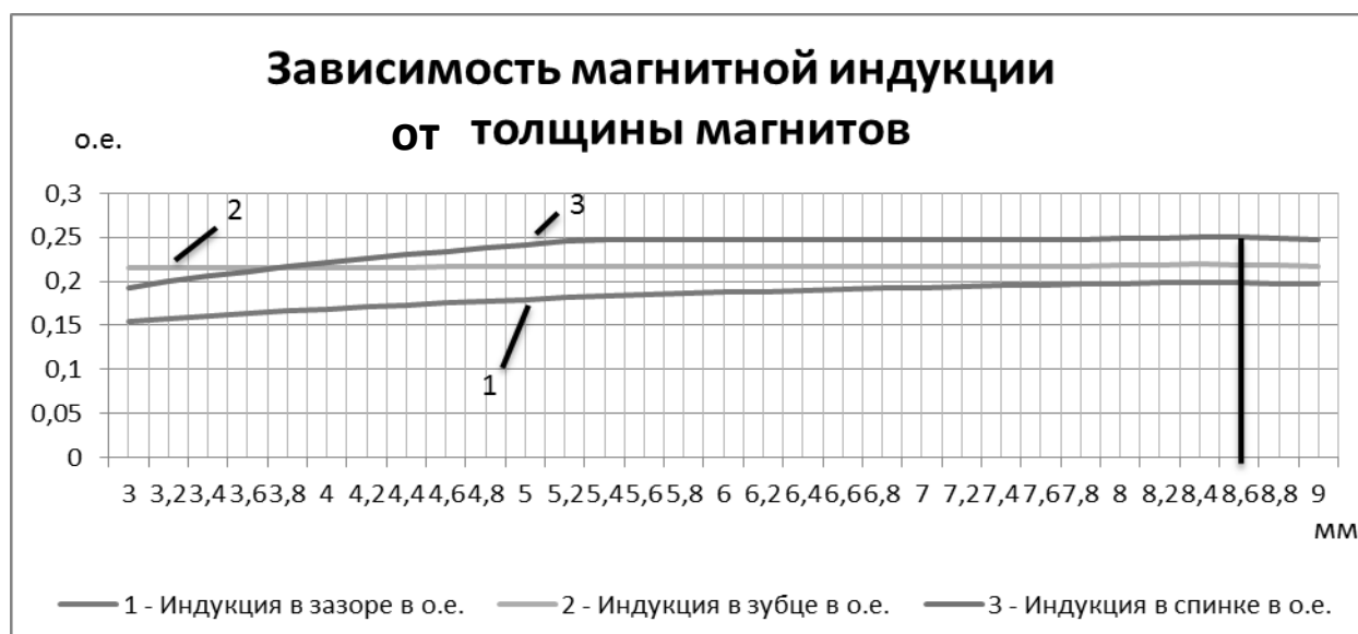
Рис. 3. Зависимость магнитной индукции от толщины магнитов высокоскоростной машины на 30 кВт

Для генераторов это ограничение определяется в зависимости от требуемой скорости запуска, для двигателя же эта величина непосредственно определяет быстродействие в динамических режимах.