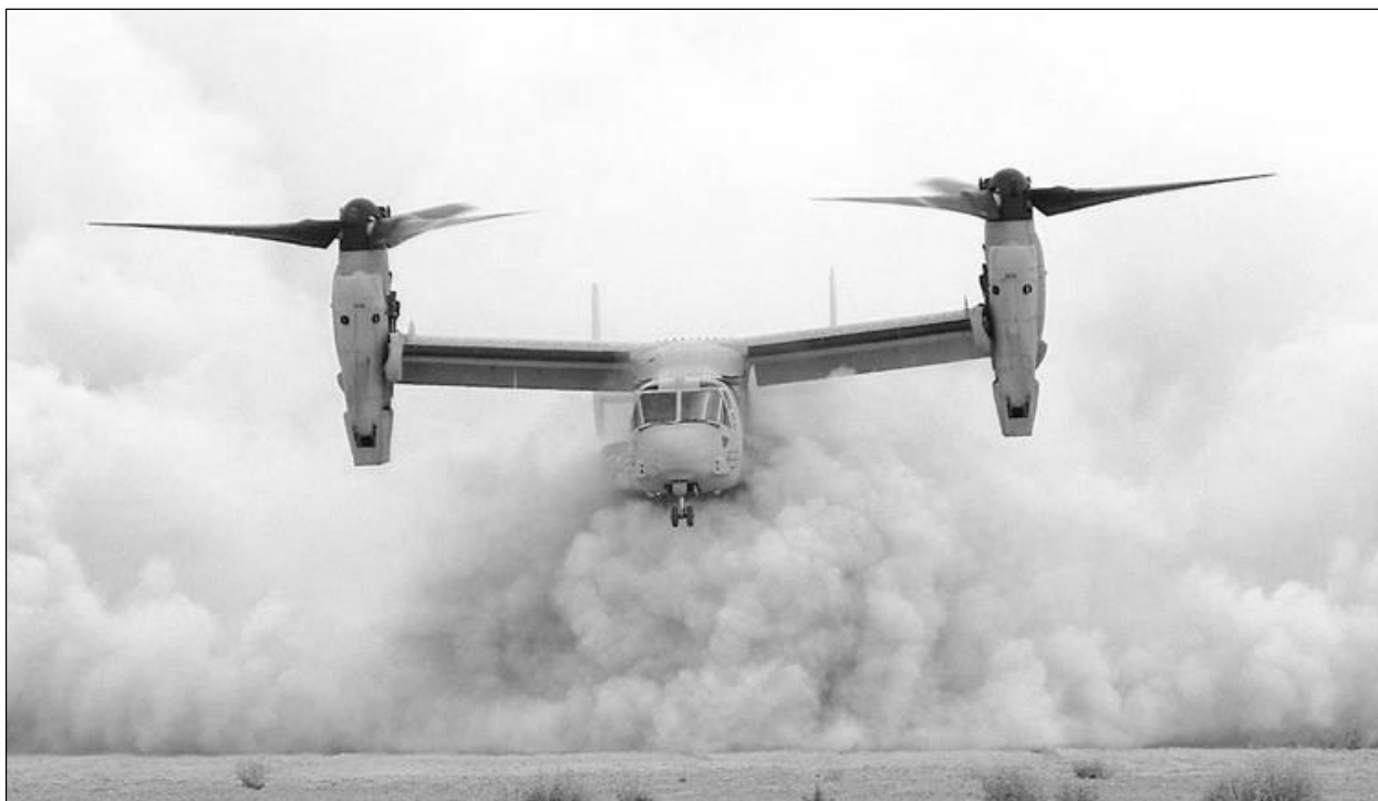
Рис. 1. Посадка в условиях повышенной концентрации пыли

С применением метода Парето был выбран оптимальный вариант геометрии ПЗУ (табл. 1).