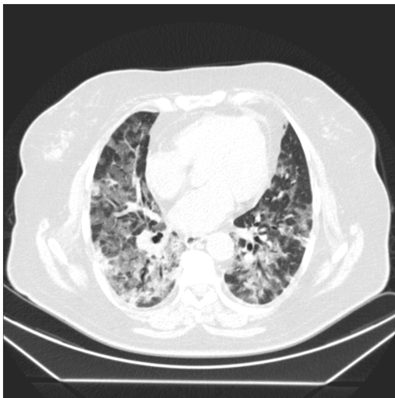
Рис. 3. Массивные зоны пониженной пневматизации по типу «матового стекла» с участками консолидации

Двусторонний характер поражения наблюдается в 57-97% случаев. У 61-86% обследованных пациентов изменения носили распространенный характер, субплевральная локализация наблюдалась у 27-41%. Распространенность утолщения междолькового интерстиция по типу «булыжной мостовой» у пациентов с COVID-19 колеблется от 0 до 14% (рис. 4).