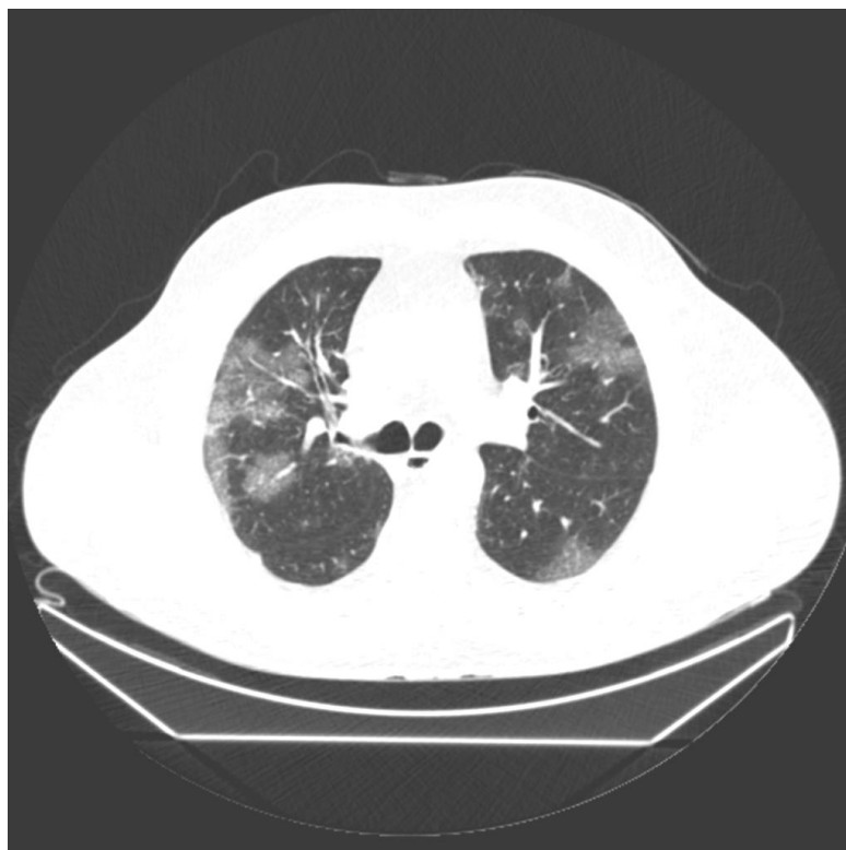
Рис. 1. Двусторонние интерстициальные изменения по типу «матового стекла»

Легочная консолидация встречается в 14–53% случаев и приобретает более обширный характер по мере прогрессирования заболевания через 10–12 дней после начала клинических проявлений (рис.2, 3).